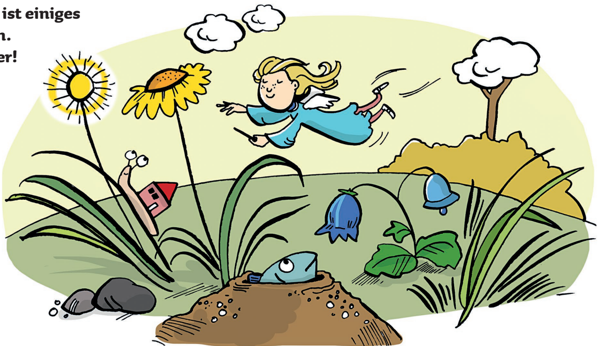
Illustration: Liliane Oser

Die kleine Fee übt auf der Wiese zaubern. Dabei ist einiges schief gegangen. Finde fünf Fehler!