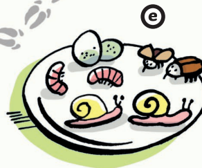
Illustration: Liliane Oser